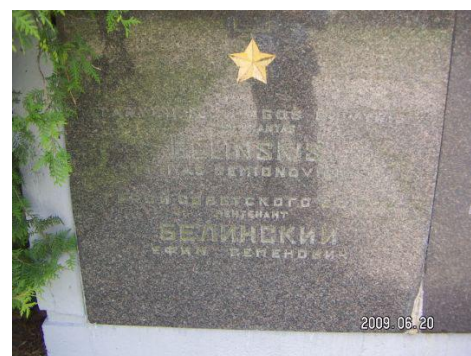
Памятный знак на месте гибели Мемориальная плита в г. Клайпеда