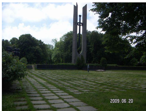
Воинский мемориал г. Клайпеда